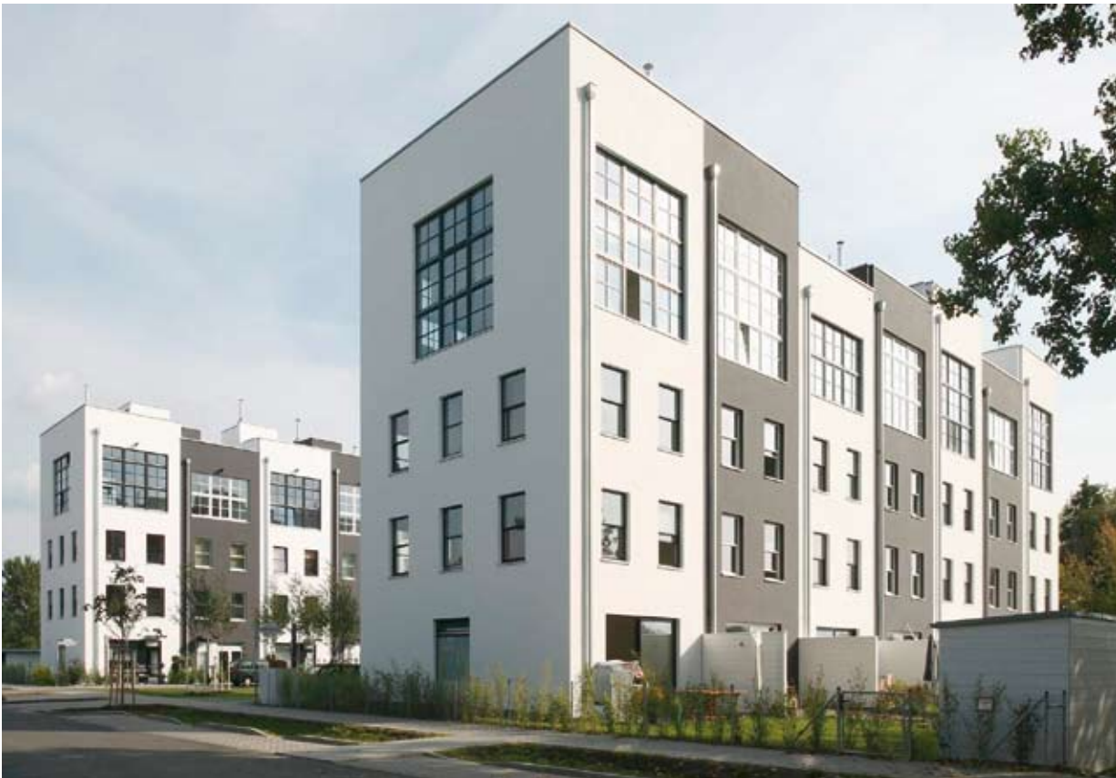
Wechselweise mit weißer und schwarzer Fassade präsentieren sich die Häuser mit jeweils schwarzen und weißen Fensterprofilen

„Weiß ist wie ein Symbol einer Welt, wo alle Farben, als materielle Eigenschaften und Substanzen, verschwunden sind. Diese Welt ist so hoch über uns, dass wir keinen Krieg von dort hören können.“ (Wassily Kandinsky: Über das Geistige in der Kunst, München 1912)